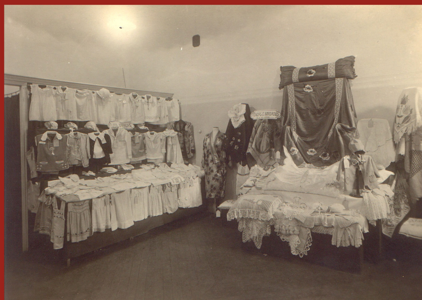
Exposição dos trabalhos produzidos pelas alunas dos cursos de Rendas e Bordados e Roupas Brancas (1928)