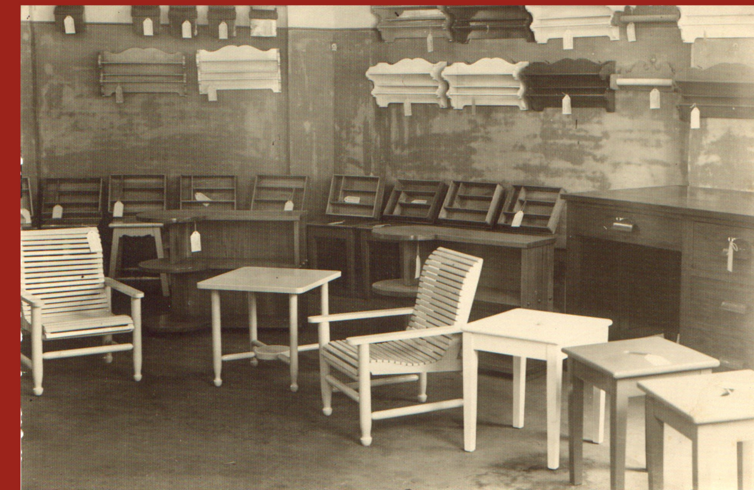
Exposição de móveis produzidos pelos alunos do Curso de Marcenaria (1948)