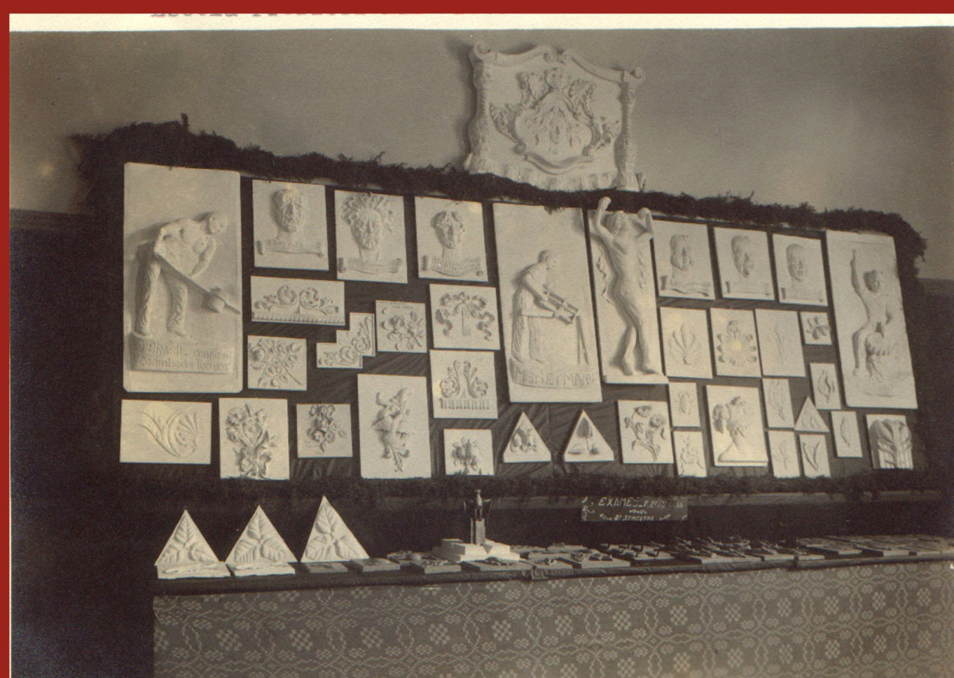
Exposição dos trabalhos produzidos pelos alunos da Seção Plástica (1940)