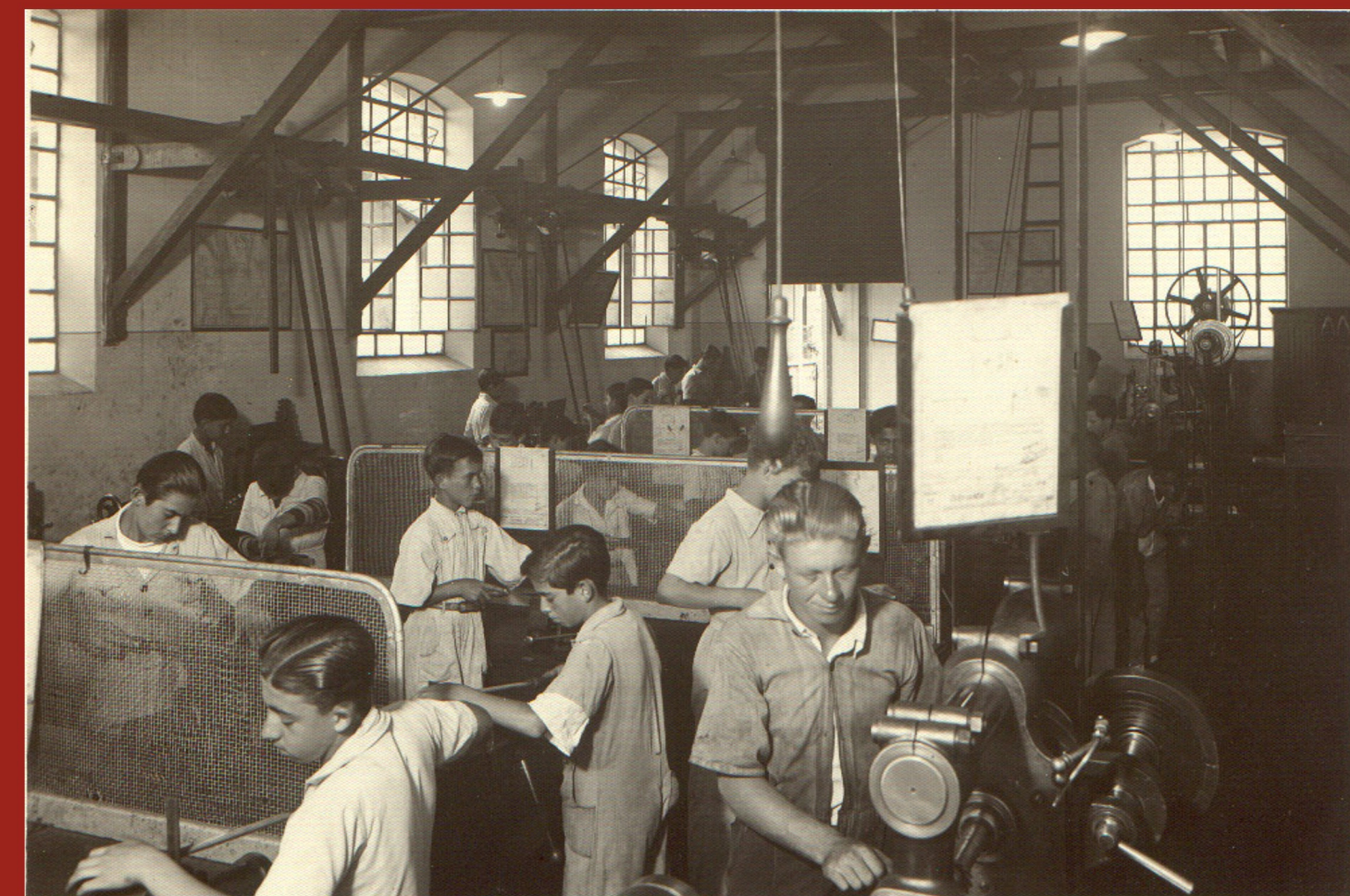
Alunos desenvolvendo trabalhos na Oficina Mecânica (1945)