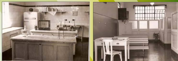
Figura 1. Estrutura física do Ginásio Industrial Estadual “José Martimiano da Silva”, 1936. Da esquerda para a direita Laboratório de aula prática e Sala de Espera de Puericultura, 1936.